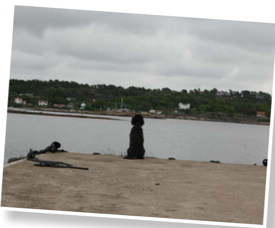
Sukk! Et helt år til neste gang. Jaja, får finne ut hvor det ble av katta, da.