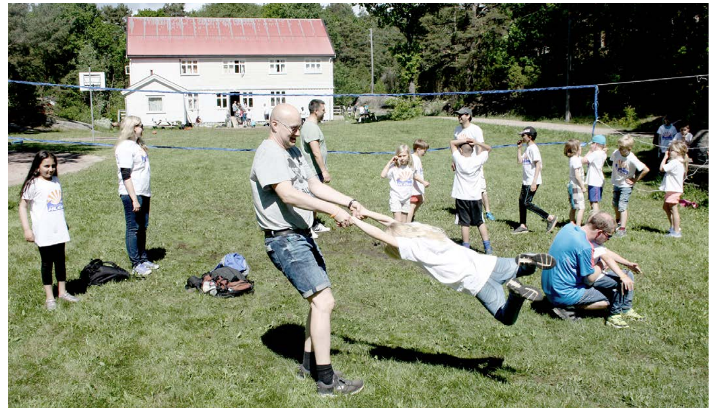
Slagbjørn Bokhyller med et 2. klasingkast