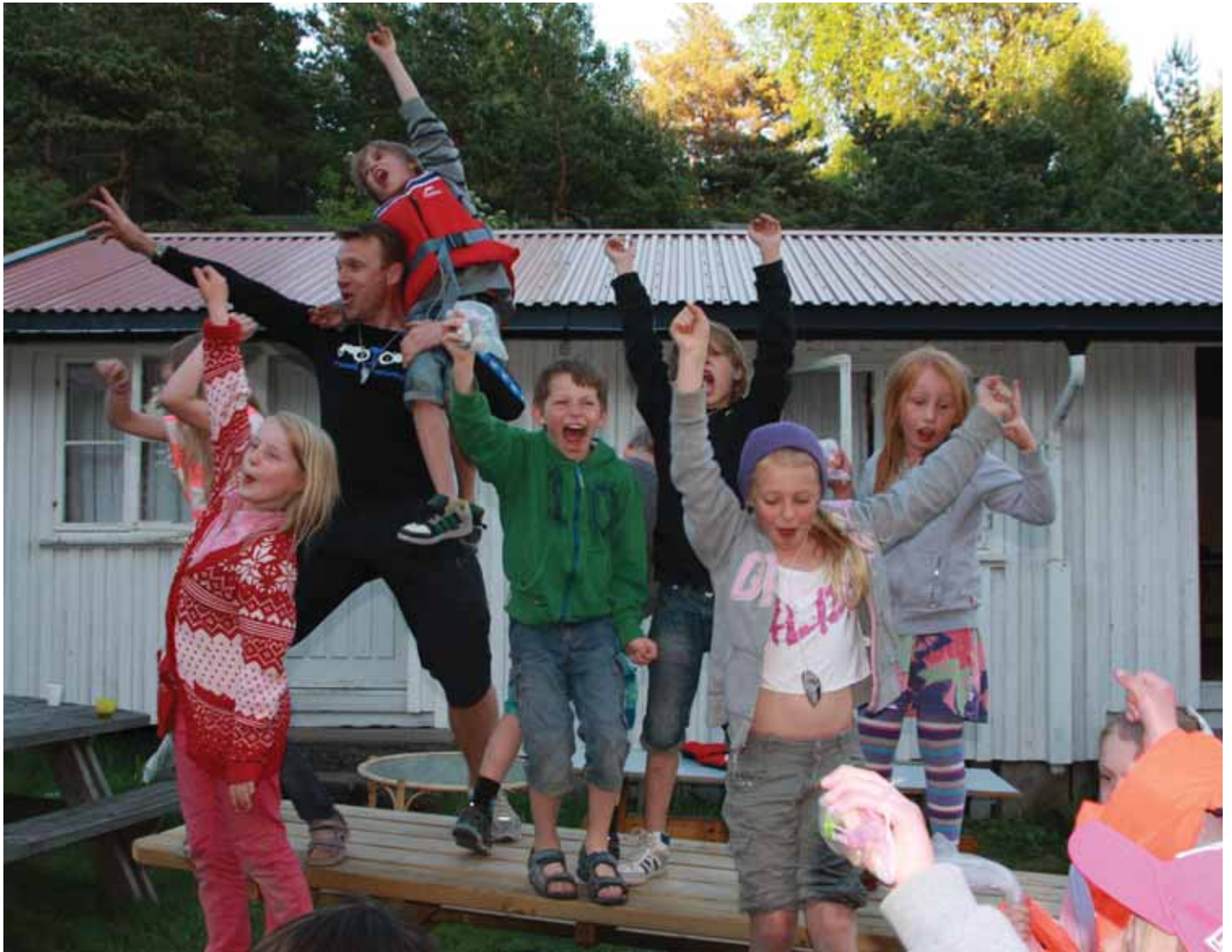
ALLE SER PÅ OSS. Sletta feirer seieren i Hudøys svar på Norske talenter.