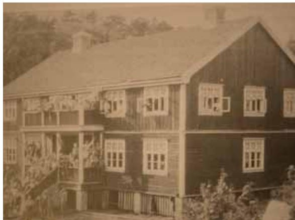
Sletta en gang for lenge siden.