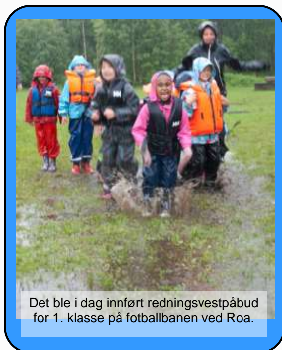
Det ble i dag innført redningsvestpåbud for 1. klasse på fotballbanen ved Roa.