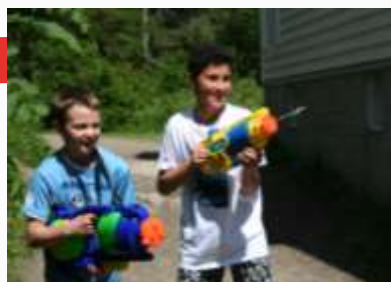
13:10 Luringer fra Lia på tokt