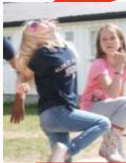
15:19 Haba Haba på Roa