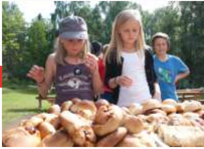
15:48 Boller i Bukta