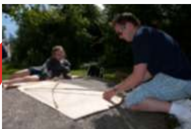
13:20 Dragebygging på Roa