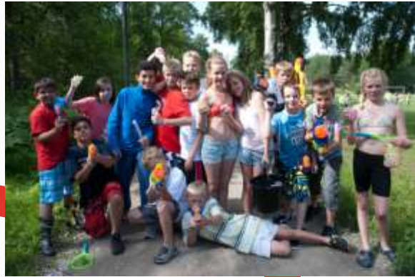
16:2 6. trinn er ladet opp til vannkrig mot Sletta