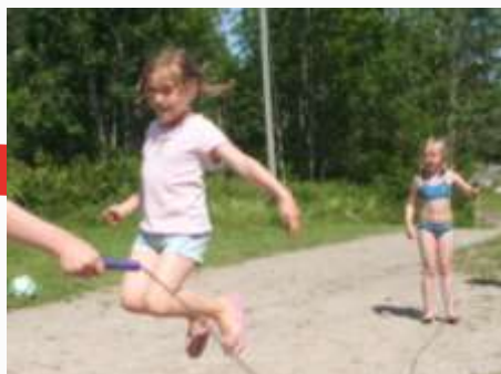
12:27 Hopp og sprett på Frydenlund