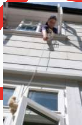
15:27 Alternativ fisking på Bukta