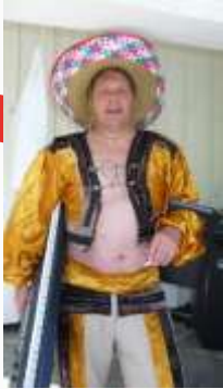
15:47 Spansk musiker hviler ut