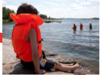
15:01 Bading ved Norda