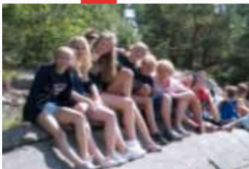
14:50 Måkeberget fanklubb