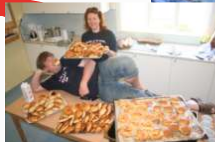
15:35 Bollekongen i Bukta