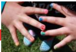
11:42 Slike fingre får man etter spabehandling på Østråt.