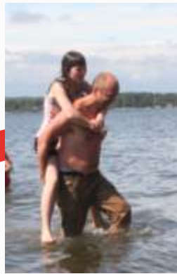
15:14 Bær meg hjem