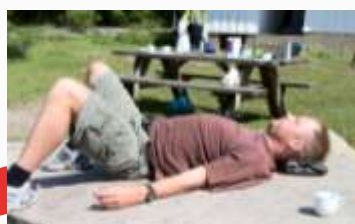
14:26 Sover litt her jeg