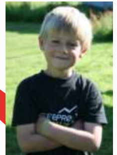
10:10 Tøffeste gutt Frydenlund