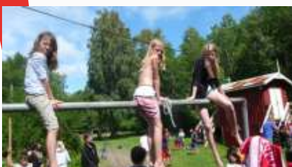
14:02 Pikene troner