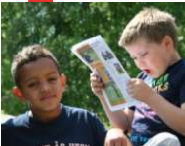
11:45 Avisen faller i smak på Østråt