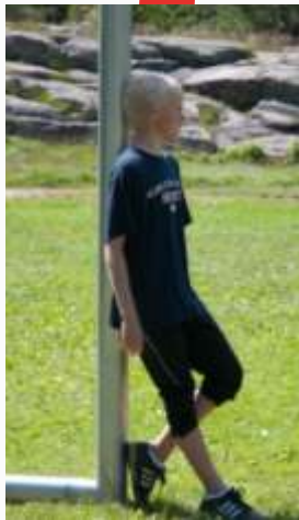
14:53 Avslappet målvakt Gjøabanen