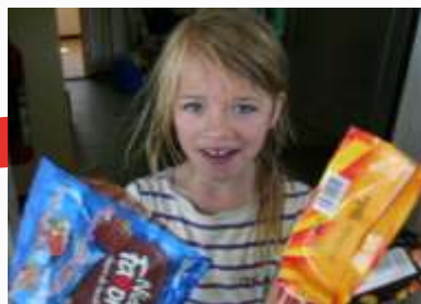
11:15 Godtedag på Frydenlund