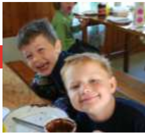
8:33 Frokostgutter Frydenlund