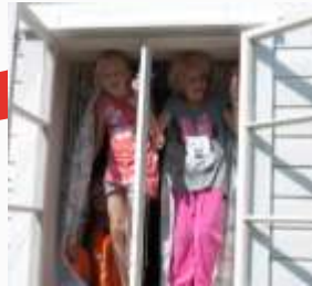
15:20 I vinduet