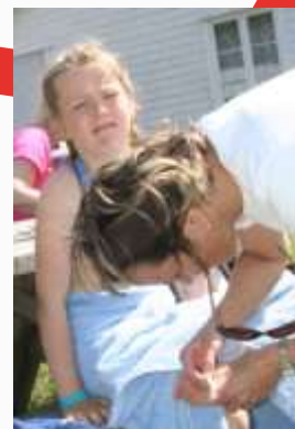
15:21 Sår i gleden på Norda