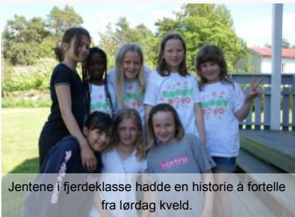
Jentene i fjerdeklasse hadde en historie å fortelle fra lørdag kveld.