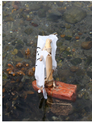
Så seiler vi hjem i en barkeboat