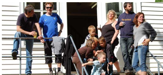
God stemning på Liatrappa