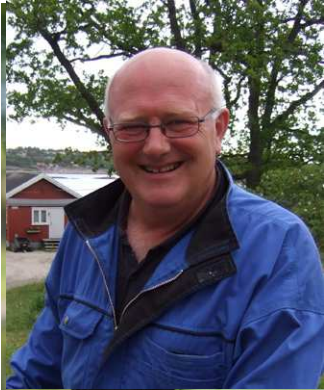
Vi sees på festen.