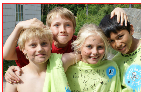
Norda ruuuler, mener dette firkløveret, etter å ha greid og regne seg frem på post i Oliaden.