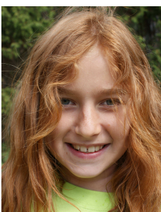
Nora fra Norda

De bildene med den elgen som hadde mista horna sine.