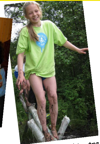
Marte fra Bukta, tre ganger over stokken