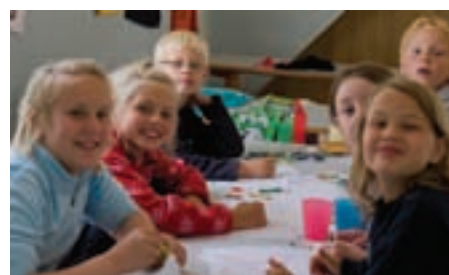
Mange benyttet gårdsdagen og regnværsperiodene til innelek. Her fra Høgda.