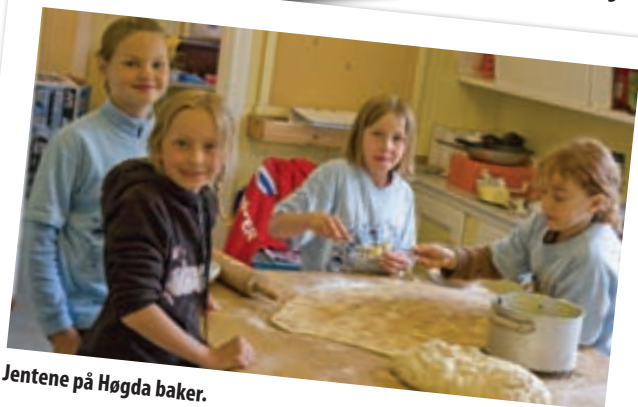
Jentene på Høgda baker.