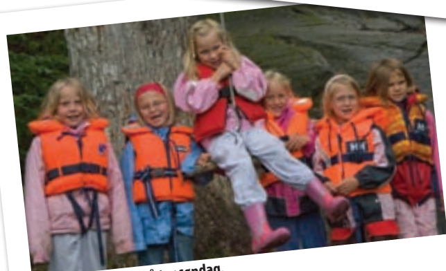
Jenter fra Østeråt på tur søndag.