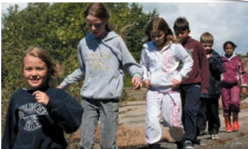
Stuntreportere fra fjerdeklasse med på tur.