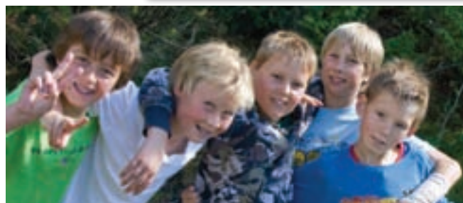
Guttene på Norda er gode venner.