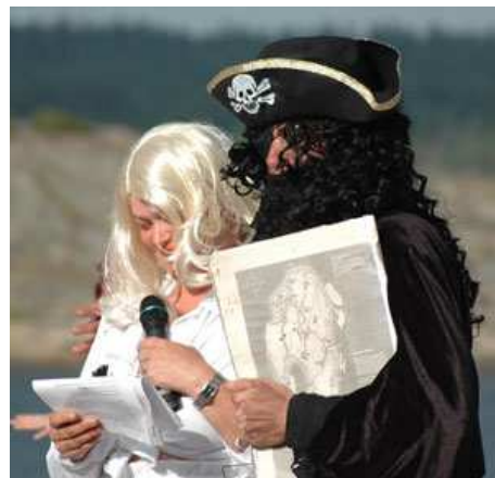
Else og Krok i et sjeldent lykkelig øyeblikk

Det hele så ut som Hudøy og alt vi har kjært var tapt. Krok hadde lurte oss og Krok hadde vunnet.