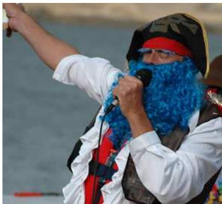
Blåskjegg sekunder før han isser i buksa...

"Du din teite saueknoke, skjønner du ikke at du har hjulpet meg å lage tidenes flotteste barnefangermaskin!" sier Krok triumferende til Møkk Ivar. Et unisont sus gikk gjennom hele forsam-