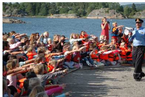
"Er det noen flere roboter her?" spør politimannen. DEEER!!! Svarer Lørenbarna unisont.

I tillegg fradømmes retten til å besøke Hudøy i ett år