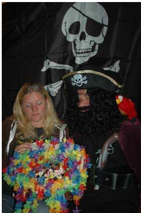
Hudøy-general Anita våget seg helt inn i kaptein Kroks hule for å snakke med den snille (?) piraten.

- Men hulen hans var skummel. Alt var svart der inne, og det var hodeskaller overalt, sier Anita i et eksklusivt intervju med Hudøynytt.