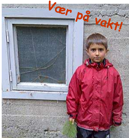
Birk fra Roa har funnet tydelig bevis på at Krok har forsøkt å bryte seg inn på Sletta..

AGURKNYTT: 9 agurker forsvant på mystisk vis fra Lia