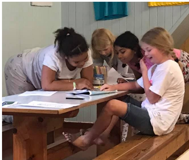
Gøy å se artikkelen sin på trykk