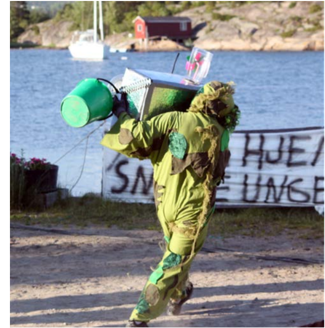
DEN GRØNNE MANNEN...