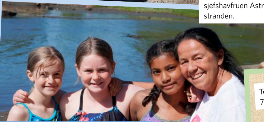
Team-Ingebrigtsen ønsket 7. en god fest!