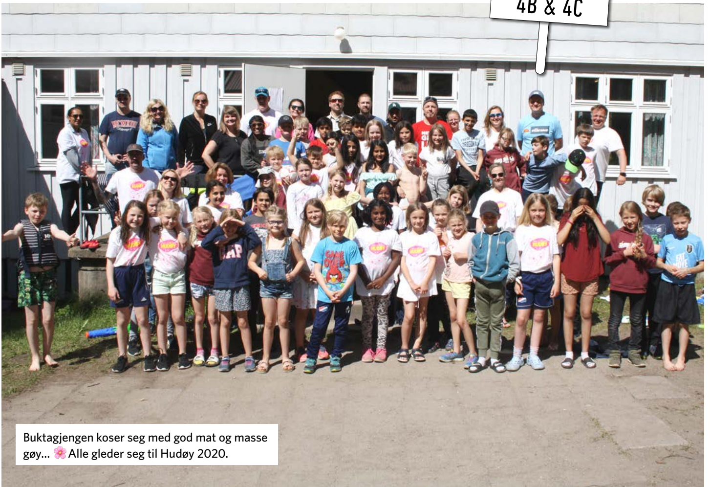
Buktagjengen koser seg med god mat og masse gøy... 🌸 Alle gleder seg til Hudøy 2020.