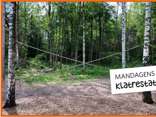
MANDAGENS LØSNING: Klatrestativet ved Liå

GÅRSDAGENS LØSNING PÅ HVA ER DETTE? ALTERNATIV A - Dette er en såkalt personsøker.