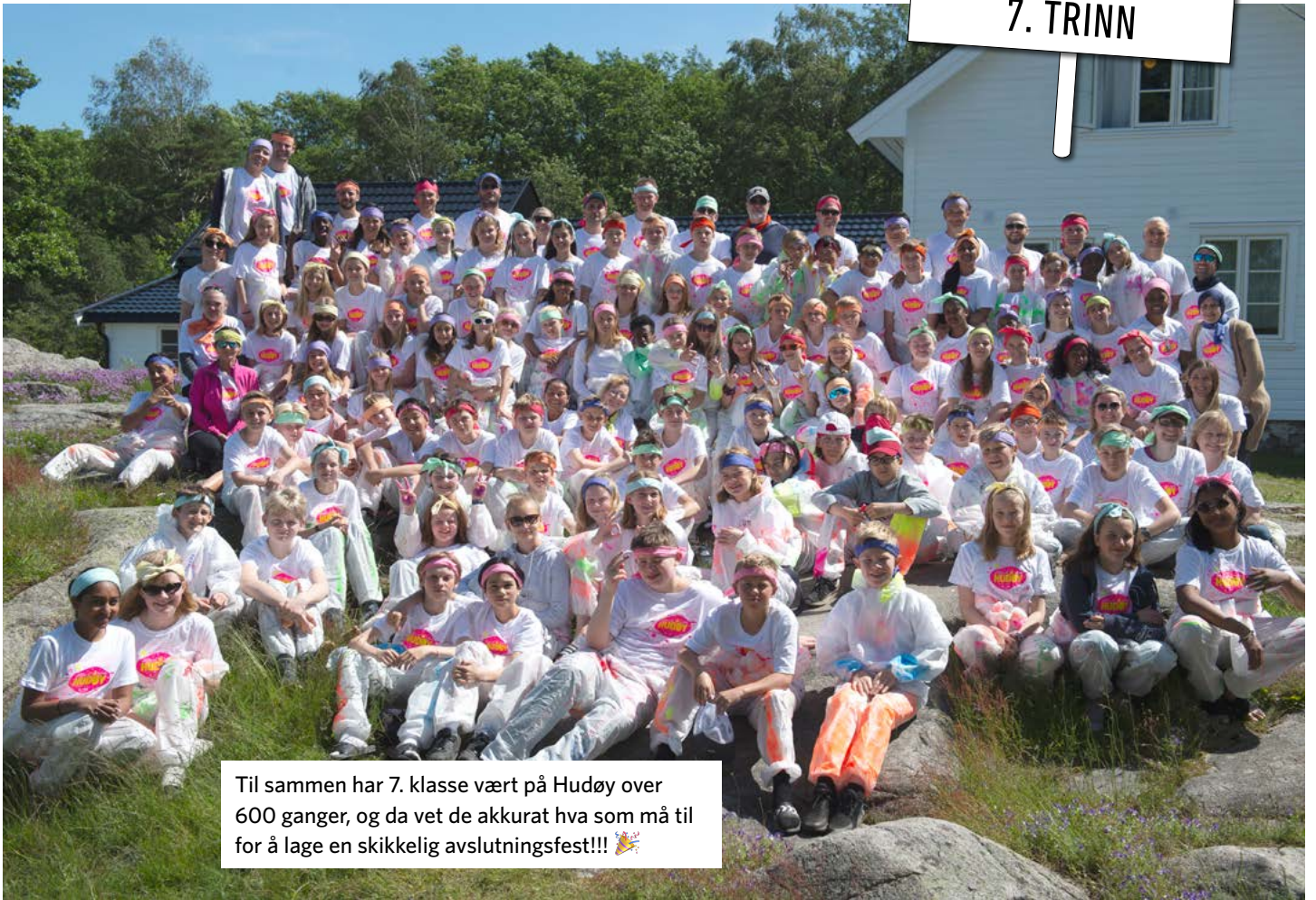
Til sammen har 7. klasse vært på Hudøy over 600 ganger, og da vet de akkurat hva som må til for å lage en skikkelig avslutningsfest!!! 🎉