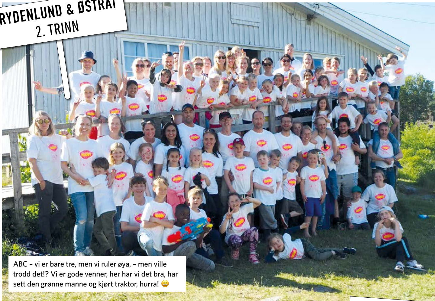
ABC - vi er bare tre, men vi ruler øya, - men ville trodd det!?! Vi er gode venner, her har vi det bra, har sett den grønne manne og kjørt traktor, hurra! 😊