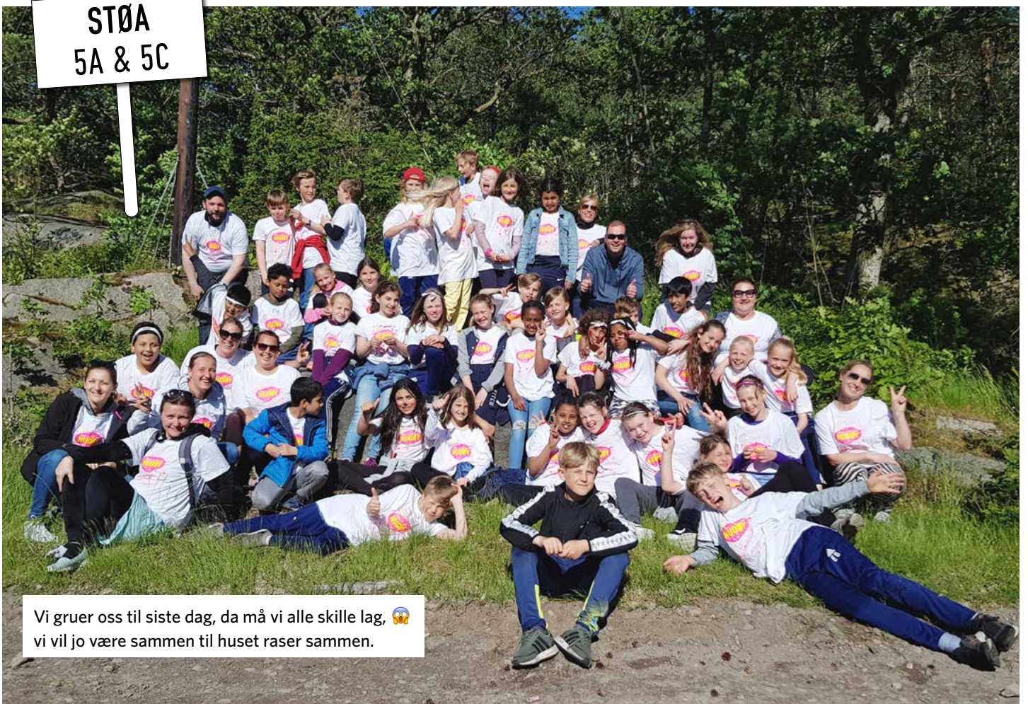
Vi gruer oss til siste dag, da må vi alle skille lag, 🙄 vi vil jo være sammen til huset raser sammen.