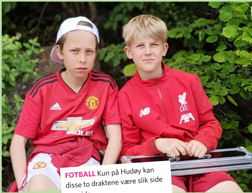
FOTBALL Kun på Hudøy kan disse to draktene være slik side om side.