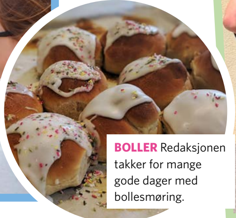
BOLLER Redaksjonen takker for mange gode dager med bollesmøring.