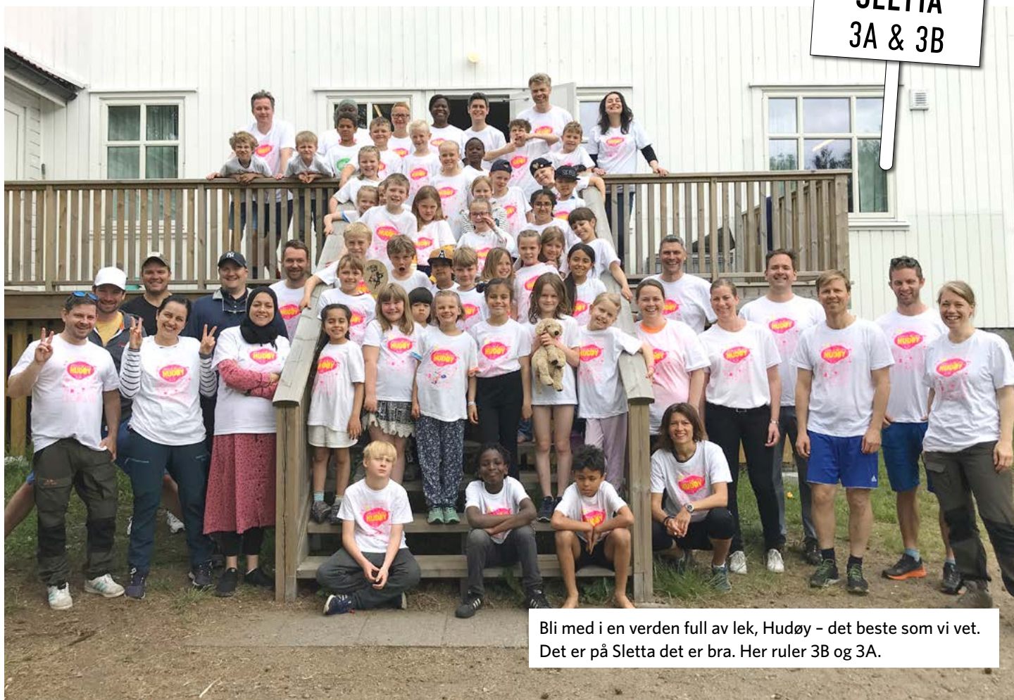
Bli med i en verden full av lek, Hudøy - det beste som vi vet. Det er på Sletta det er bra. Her ruler 3B og 3A.