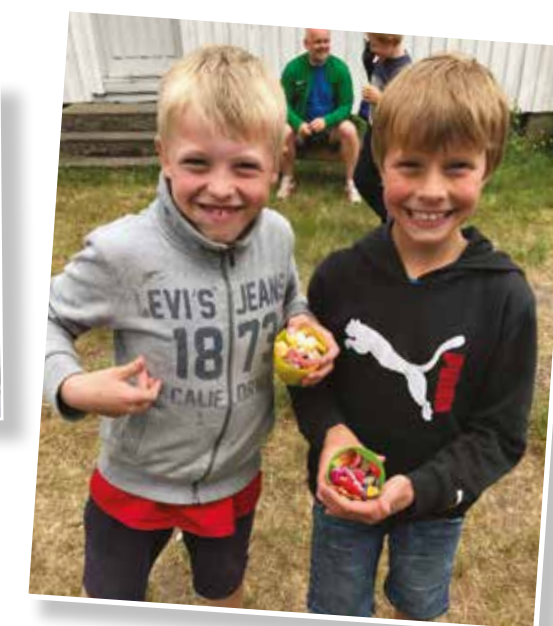
Godisglis på Sletta!

Zombifisering av andreklassing etter ganske alvorlig hodeskade på Østråt. Vær forsiktig når du slenger rundt på tunge ting, sier offeret.