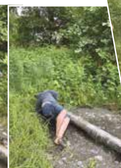
Stiv som en stokk!