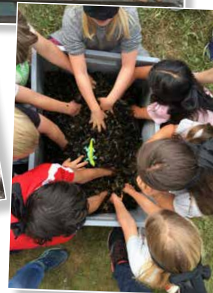
Sjokoladegjengen fra Sletta