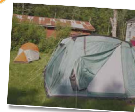
Hytte med utedo