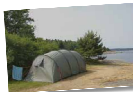
Telt på funksiplatå med havutsikt