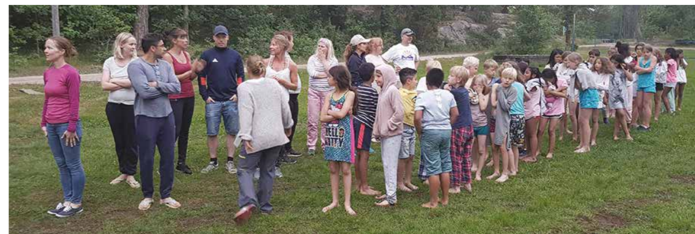
Alle barna på Høgda hadde lagt seg da brannalarmen gikk. Heldigvis var det ikke ordentlig brann, det var de voksne som hadde stekt smør i stekepanna på en måte som gjorde at brannalarmen gikk. Alle kom seg ut av sengene og stilte opp utenfor slik de hadde øvd på. Alle ble telt opp, situasjonen avklart og brannalarmen slått av slik at alle kunne gå inn og legge seg igjen.