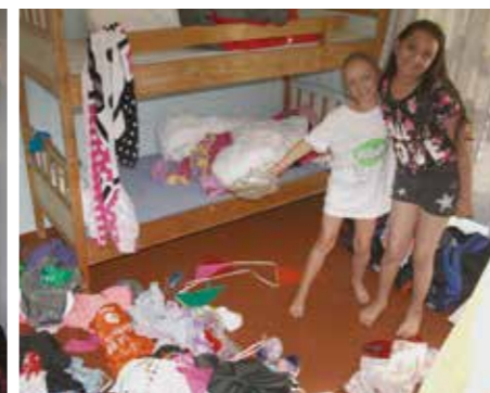
Rydding av ymse kvalitet er også noe man finner på jentenes sovesal.