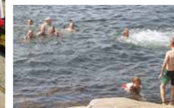
7. trinn prioriterte svømming fremfor slit-somme fotballkamper i varmen!