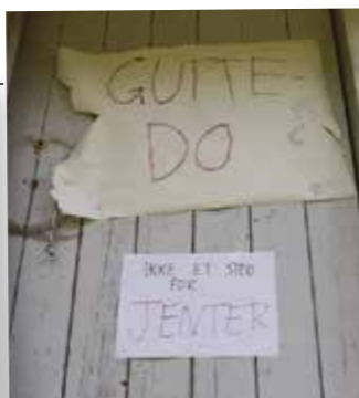
Diskriminering på Støa?