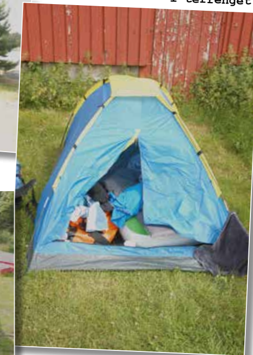
Biltemas modell THE DOGHOUSE