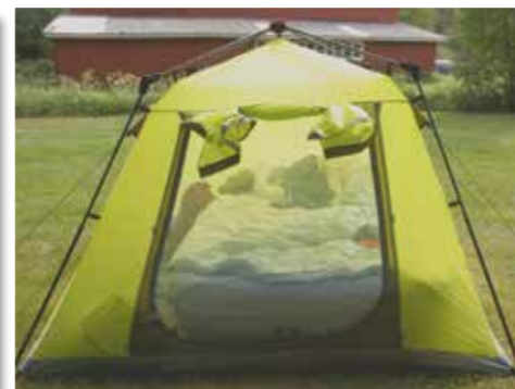
Kandinskyinspirert Ali Babamodell