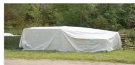
Star Trek modell (landet 9.6.)