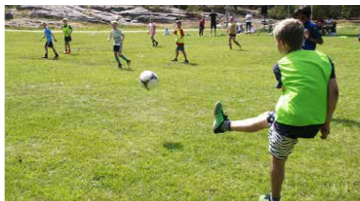
Actionbildet fra semifinalen.