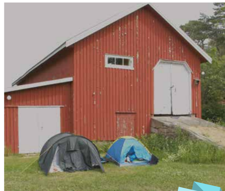
Teltleir på kant med låven