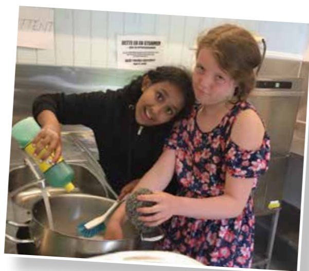
Jentene på Støa bidrar gjerne på kjøkkenet.