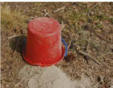
Øyas minste telt