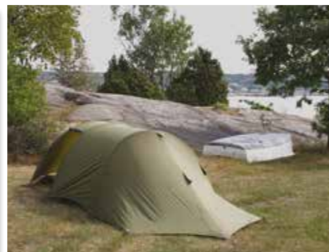
Den Maritime med båtfeste