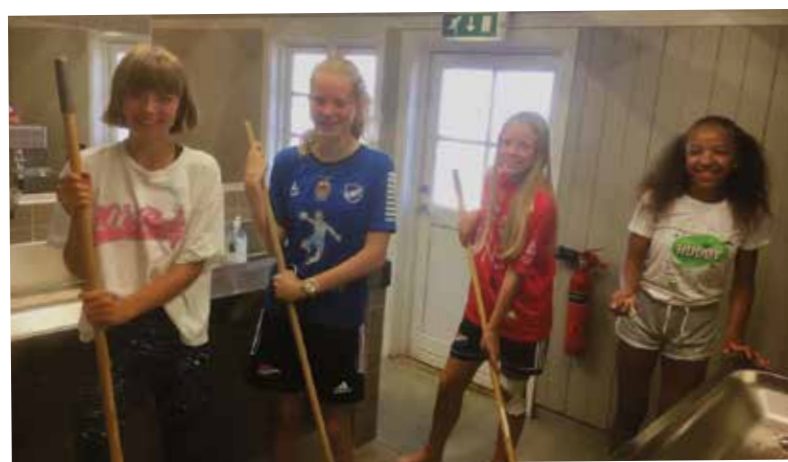
4 jenter fra 7. trinn ble funnet på badet på Stranna. Helt uoppfordret hadde de vasket bad og dusj. Best av alt: på spørsmål om hvilken klasse de gikk i, kunne de ikke svare umiddelbart, og korrekt svar var én fra hver klasse, ABCD:-)