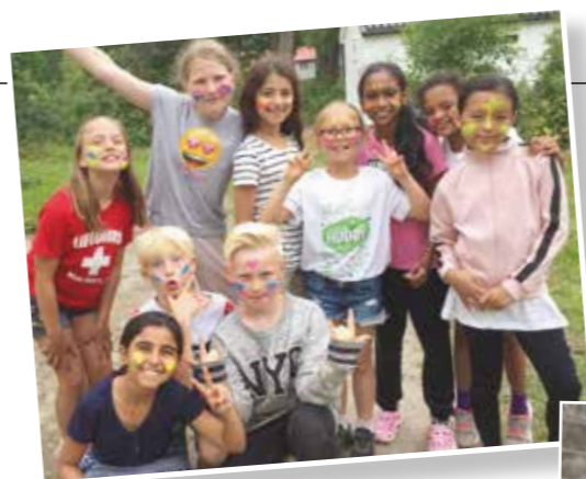
Discofest på Høgda!