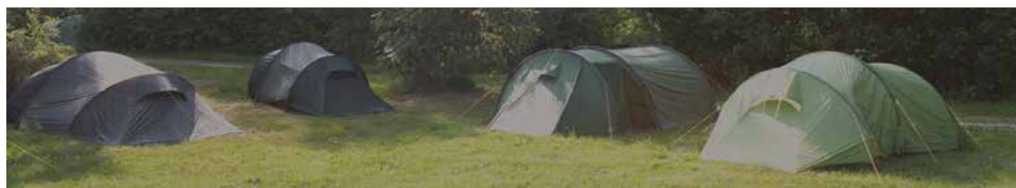
Rekkehus på punktfestetomter