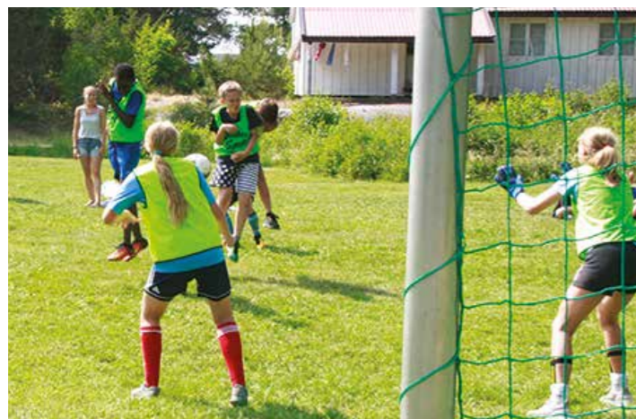
Jaaaaaaa, vinnermålet som sikret seieren til Roa City!!!

Vi er best i verden!! vi er best i verden!! Vi har slått dere alle, Hudøy-generalen, Kaptein Krok, Else og alle landkrabber. Saken er biff, saken er karbonade, saken er ertesuppe. Årets cup var en seier for barn som elsker fotball, rettferdighet og glede.