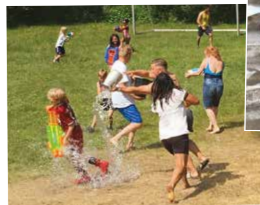
Vannkrig Bukta vs Høgda