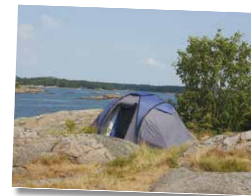
Arnebergmodell bygd inn i terrenget