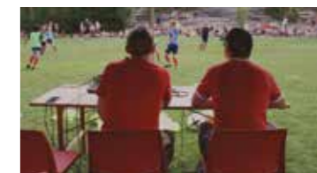
Turneringens speakere underholdt publikum og delte ut iskaldt drikke for imponerende handlinger!

1. Her tok laget eget initiativ...satte opp system - lagoppsett for alle 3 kamper slik at alle skulle få lik spilletid, spille der de er best og jevn fordeling gutter å jenter!