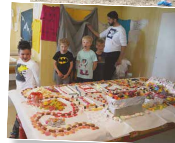
Øyas første godteribordtips var fra Østråt.