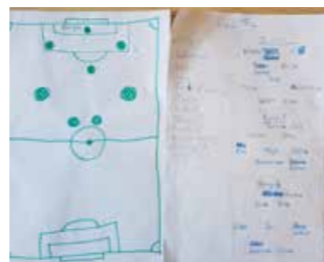
2. Her er taktikken i detalj