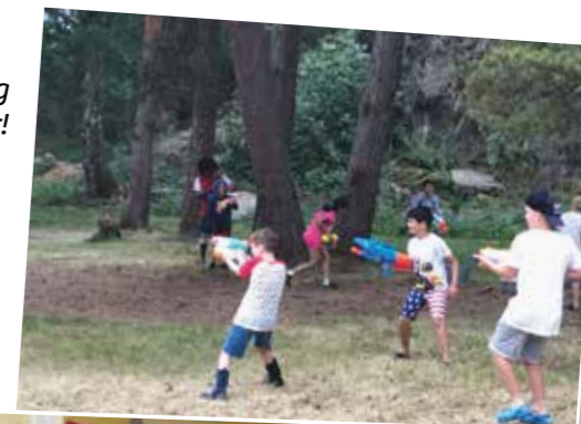
Vannkrig i alle skoger!