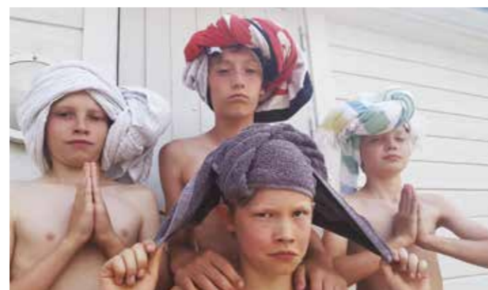
Turbankameratene fra Norda