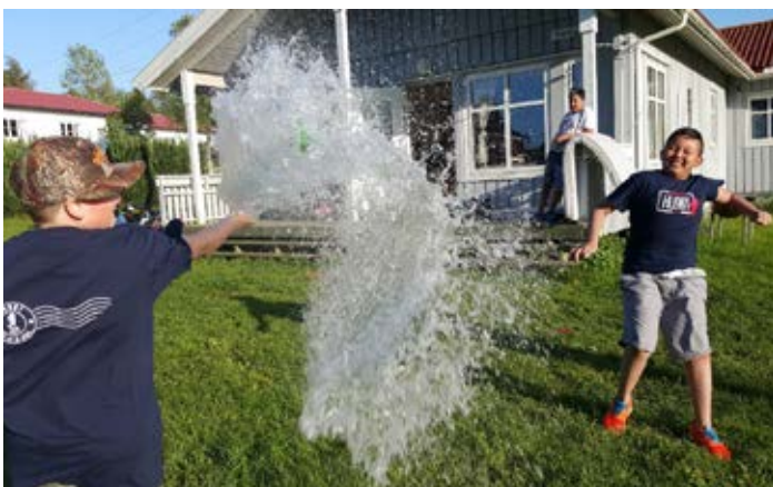
Første bilde av vannballonslag