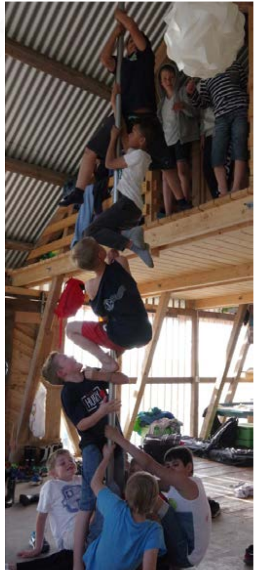
Alle gutta på Norda vil være Brannmann Sam...