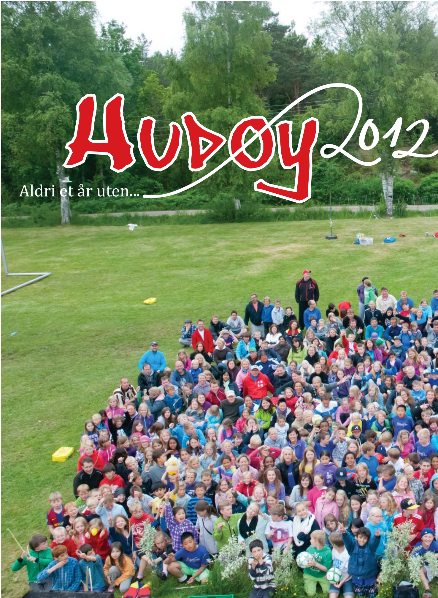
Alle Hudøy-deltakere 2012 samlet ved Roa tirsdag. Justin Bieber var også tilstede da bildet ble tatt. Kan du kjenne ham igjen? Finnerlønn: 1 iPo