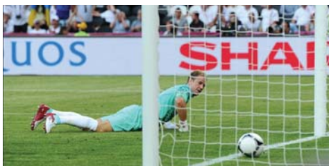
Englands keeper Joe Hart ser ballen gå inn i nettet bak seg

Ukraina, for dagen i helgule drakter, knuste Sverige i sin åpningskamp i EM. Den gamle Milan og Chelsea helten Andrej Schevchenko ble den store helten med sine to scoringer, begge på headinger. Sveriges store stjerne, Zlatan Ibrahimovic ga Sverige ledelsen tidlig i 2.omgang, men våre naboer i øst måtte tilslutt gå av banen med tap. På torsdag møter Sverige England, en kamp de må vinne for å ha sjanse til avansement i EM.