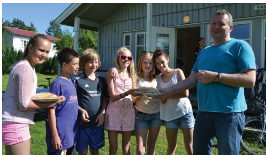
Norda kom med nydelig lasagne til oss i dag. Vi ble mette!