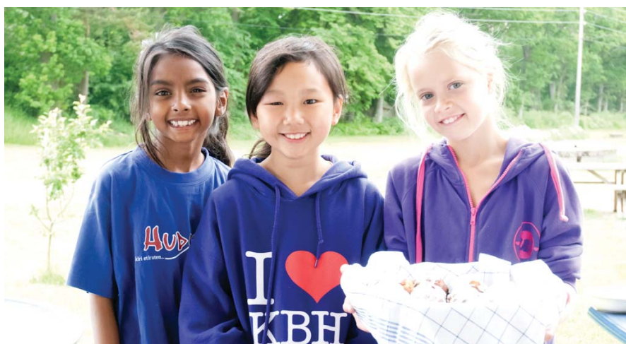
Støajentene hadde laget muffins kun til redaksjonen. Vi takker! De var veldig gode!