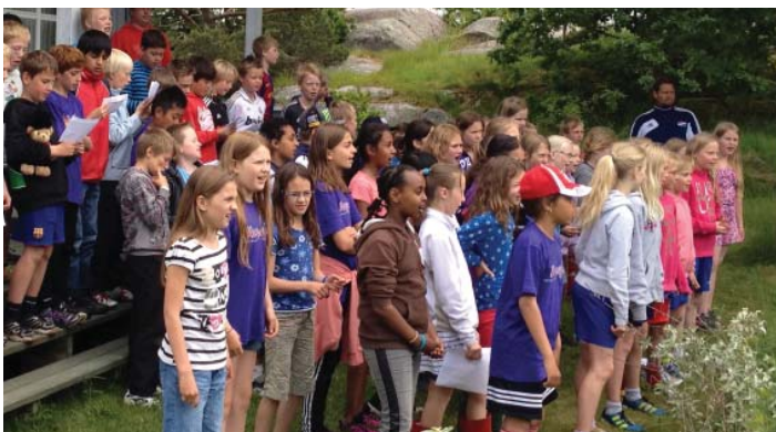
I fyr og flamme! Bare femteklasser fikk se Justin spille på Roa.

Dette spilte Justin Bieber: One Time, Baby, One Less Lonely Girl og Hudøysangen