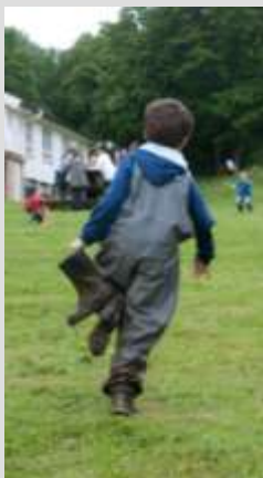
Løs fra gjørmen: Guttens kamp med gjørmen endte med en slagstøvel i hånden.