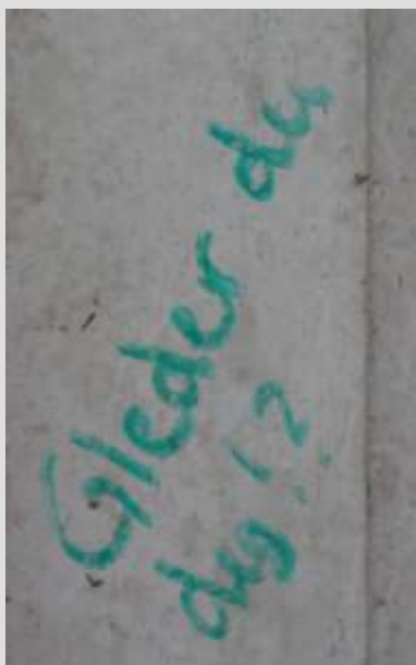
Dopoesi: Dette er et spørsmål alle må stille seg for man går på do?